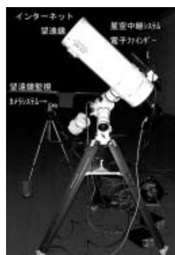
図1: 宮教大インターネット天文台外観とインターネット望遠鏡.