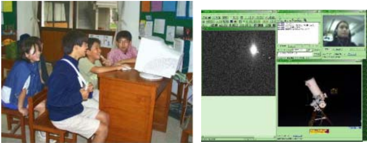
図3 (左)ニューデリー日本人学校の児童が宮教大インターネット望遠鏡を操作、学生解説員と会話している様子。(右)木星をとらえた PC 画面。左から、撮像天体(木星)ウィンドウ、学生解説員ウィンドウ、望遠鏡映像ウィンドウ。