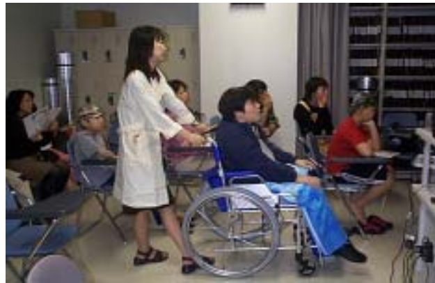
図4 東北大学大学病院院内学級における授業の様子。(左)生徒がパソコン操作により天体(M3)を導入。(右)児童全員で天体を観察。