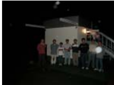
天文台の前でパチリ